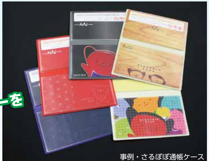
事例・さるぼぼ通帳ケース